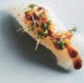
N9 GRILLET KINGFISH 1 stk 25,- 2stk 45,-