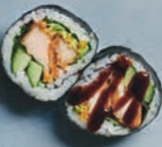
F4 DYBSTEGT KYLLING ROLL 6 stk. 85,- Dybsteget kylling, avocado, agurk, mix salat, teriyaki sauce