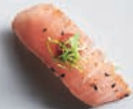
N6 TUN TATAKI 1 stk 25,- 2 stk 45,-