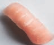
N5 TUN 1 stk 25,- 2 stk 45,-