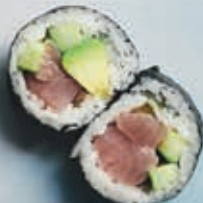
F2 STOR TUN 6 stk. 85,- Tun, agurk, avocado