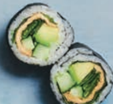
F6 VEGGIE 6 stk. 85,- Tofu, agurk, sukkerærter, mix salat, avocado