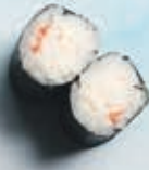
H3 8 stk. 45,- Crabstick