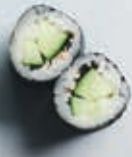
H5 8 stk. 45,- Agurk