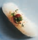
N10 SPICY KINGFISH 1 stk 25,- 2 stk 45,-