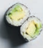
H6 8 stk. 45,- Avocado