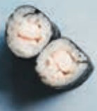
H4 8 stk. 45,- Tigerreje