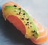
N4 LAKS MED AVOCADO 1 stk 25,- 2 stk 45,-