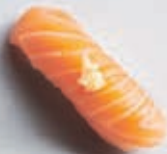
N2 LAKS MED HVIDLØG 1 stk 25,- 2 stk 45,-