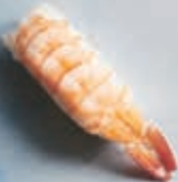
N7 TIGERREJE 1 stk 25,- 2 stk 45,-