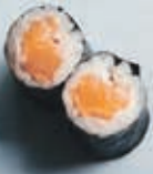
H1 8 stk. 45,- Laks