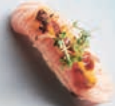
N2 GRILLET LAKS 1 stk 25,- 2 stk 45,-