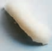
N8 KINGFISH 1 stk 25,- 2 stk 45,-