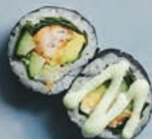
F5 DYBSTEGT TORSK ROLL 6 stk. 89,- Dybsteget torsk, avocado, agurk, mix salat, wasabi/lime creme