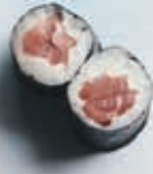
H2 8 stk. 45,- Tun