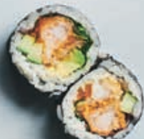
F3 EBI TEMPURA ROLL 6 stk. 85,- Dybsteget reje, agurk, avocado, flyvefiskerogn, mix salat, spicy mayo