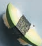
N11 AVOCADO 1 stk 20,- 2 stk 35,-