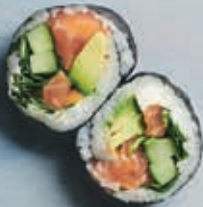
F1 SAKE LAKS 6 stk. 85,- Laks, agurk, avocado, flødeost, mix salat