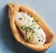
N12 TOFU 1 stk 20,- 2 stk 35,-