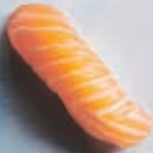
N1 LAKS 1 stk 25,- 2 stk 45,-